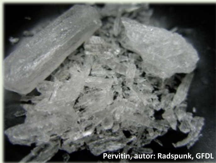
Pervitin, autor: Radsfunk, GFDL

konzumace a dostupnost drog i závislost na hracích automatech – i zde Češi vedou, což by nás však nemělo vůbec těšit!