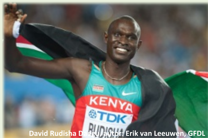
David Rudisha Dáegu

V květnu zveřejnila Světová antidopingová agentura WADA na internetových stránkách svoje stanovisko k níže uvedené reportáži, kterou odvysílala Keňská veřejnoprávní televize.