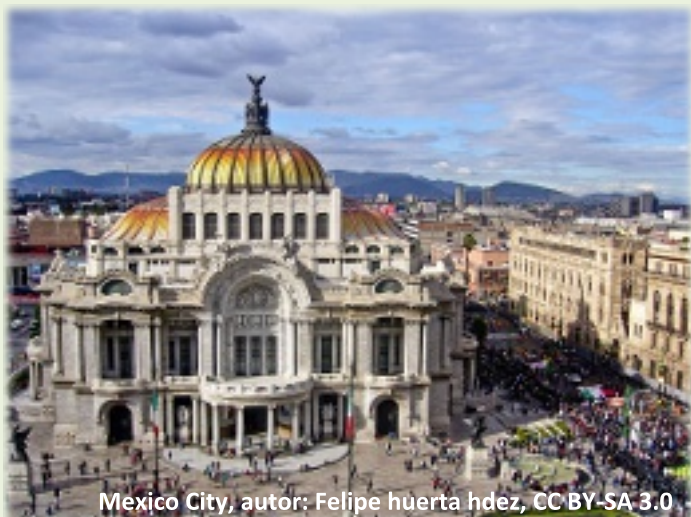
Mexico City, autor: Felipe Huerta Hdez, CC BY-SA 3.0

Je to velice nepříjemná situace pro celou tuto oblast, protože nejbližší laboratoř je až v Riu de Janeiro nebo USA, a tak se vyhodnocování odebraných vzorků sportovců Mexika i okolních států ještě více prodrazí v důsledku zvýšení přepravních nákladů.