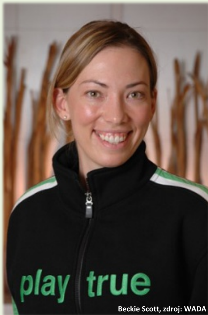
Beckie Scott

Oproti roku 2016 nedošlo v čele komisí k žádným personálním změnám.