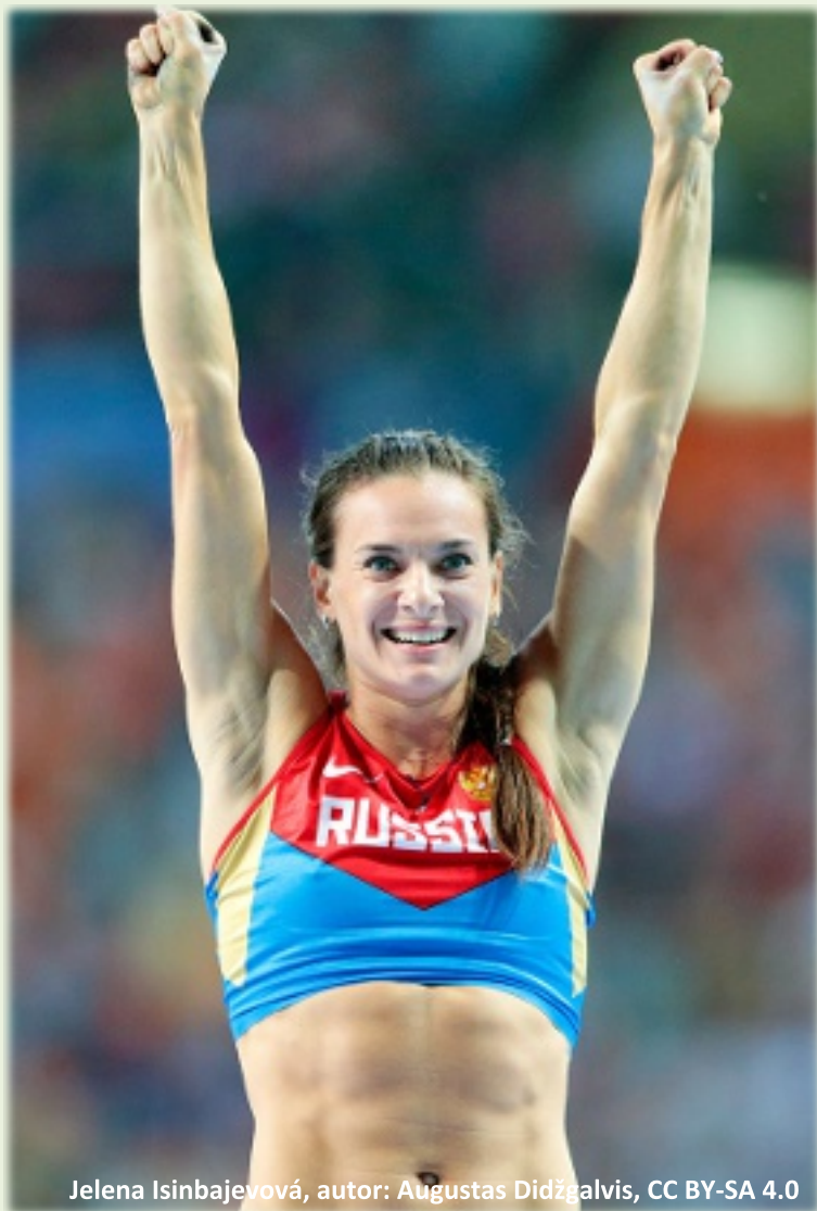
Jelena Isinbajevová

Zpráva obsahuje 1 166 důkazů – emaily, dokumenty a biologické vzorky a neopírá se pouze o ústní svědectví, ale o konkrétní důkazy a stopy. K zatajování pozitivních testů a změrným manipulací se vzorky docházelo podle WADA ve více než 30 sportech – 600 pozitivních případů dopingu se odehrálo v letních sportech a celkem 95 v zimních odvětvích. Doping se v této zemi nevyhýbal ani handicapovaným sportovcům. Byl zaměřen hlavně na velké akce včetně olympiády v Londýně 2012, atletického mistrovství světa v Moskvě 2013 a zimních olympijských her v Soči 2014.