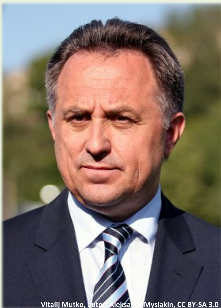
Vitalij Mutko

Tato zpráva uvádí, že více než tisíc sportovců profitovalo mezi roky 2011 až 2015 ze systematického dopingu v zemi, který byl opětovně zaveden a organizován státními orgány, konkrétně ministerstvem sportu, ruskou antidopingovou agenturou (RUSADA), moskevskou antidopingovou laboratoří a tajnými službami (hlavně FSB). Vše odstartoval neúspěch ruských sportovců na zimní olympiádě ve Vancouveru (2010), kdy ministerstvo sportu vytvořilo akční (čti dopingový) plán, jak s dopomocí zakázaných látek a metod dosáhnout nejvyšší výkonnosti.