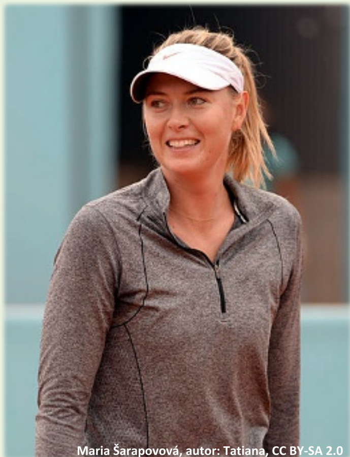
Maria Šarapovová