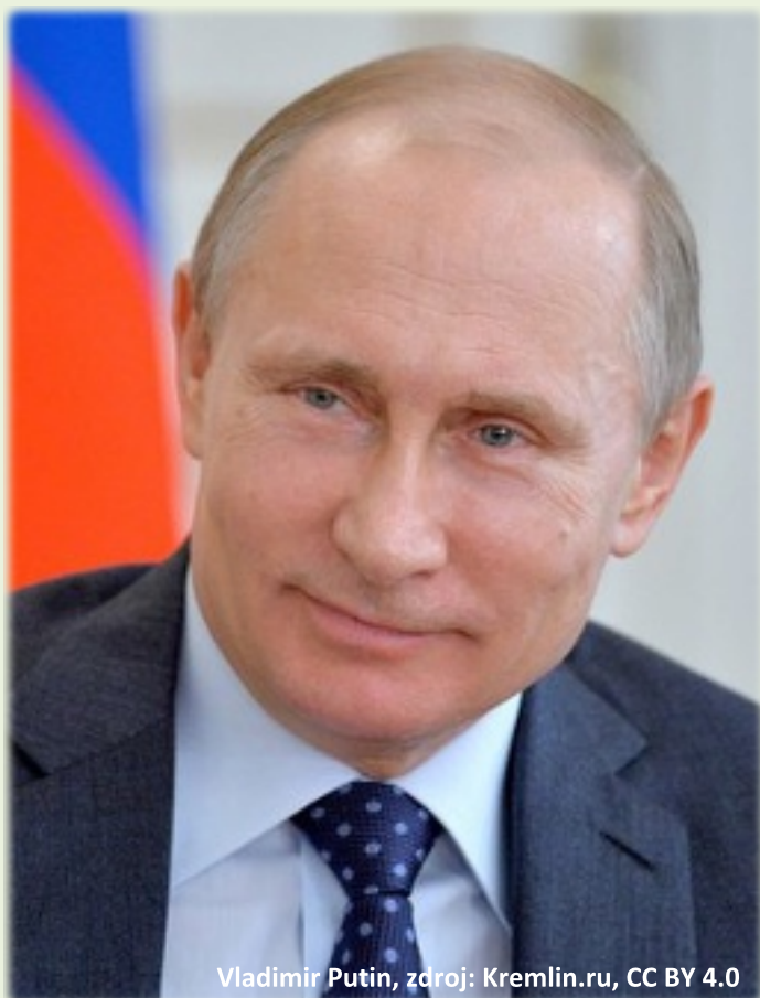
Vladimir Putin

Ruský prezident Putin přiznal, že antidopingový program v jeho zemi měl problémy.