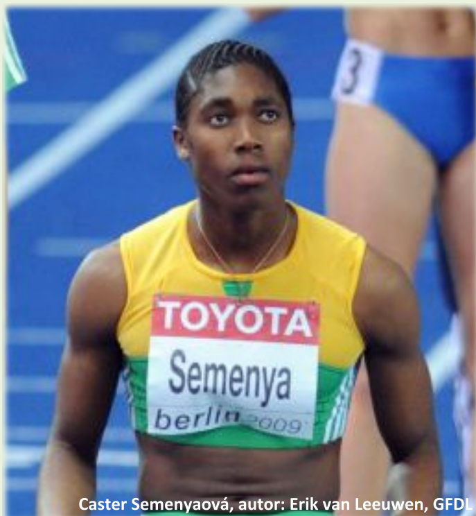
Caster Semenyaová

Podrobnou zprávu naleznete na portálu WADA .