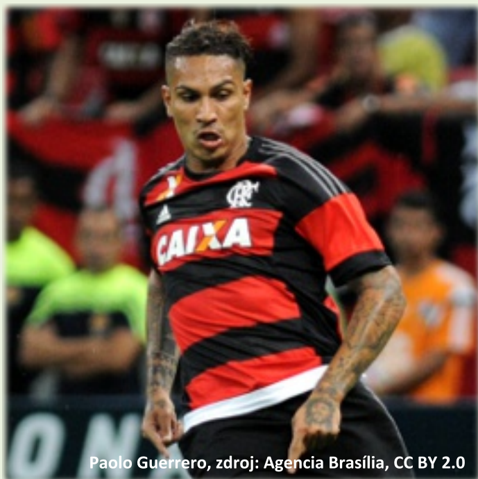
Paolo Guerrero

Kapitán Peru Paolo Guerrero přijde definitivně o MS.