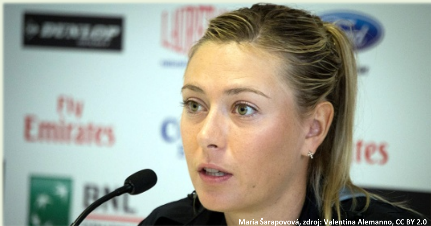
Maria Šarapovová

Když se před rokem v dubnu vracela Maria Šarapovová po zkráceném trestu (15 měsíců nepodmíněně) do tenisového kolotoče, mnozí odborníci si kladli otázku, zdali se jí podaří se zase dostat na vrchol či nikoli.