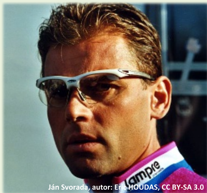
Ján Svorada